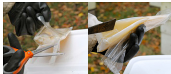
Abb. 1/III. 1/Fig. 1